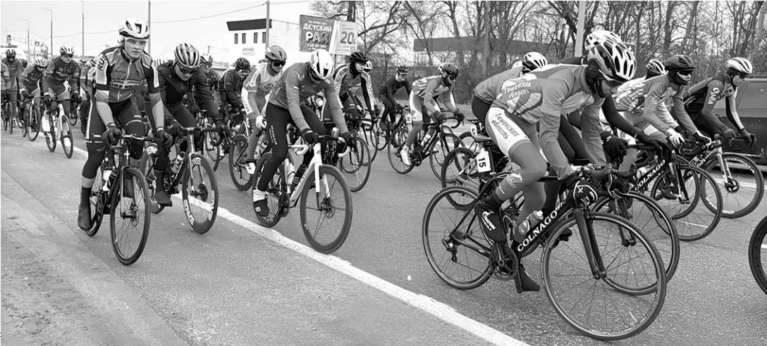
В соревнованиях приняли участие опытные велогонщики из 19 регионов страны