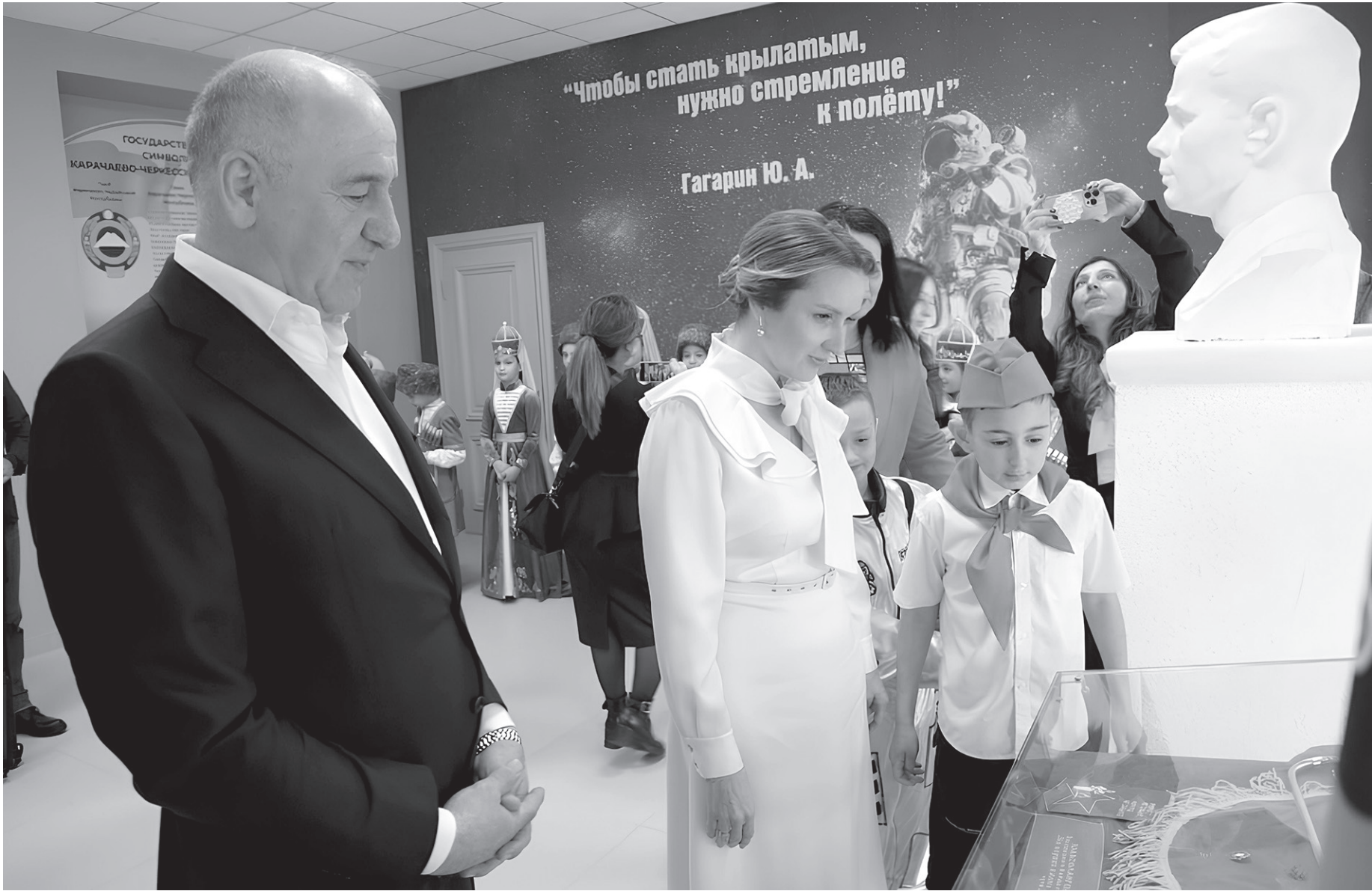
Рашид Темрезов и Мария Львова-Белова знакомятся с экспонатами выставки в обновленном центре культурного развития

— Когда попадаешь на такие мероприятия, то непременно сопереживаешь с историей страны. Представляете, 64 года тысячи